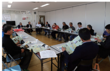
名島橋のある名島校区自治協議会の皆さんとの交流 (福岡市)